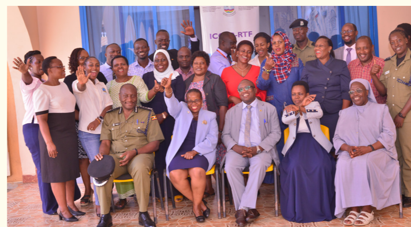
Representantes de diferentes organizações durante a Avaliação de Impacto do modelo IntegraModel no Uganda 2023