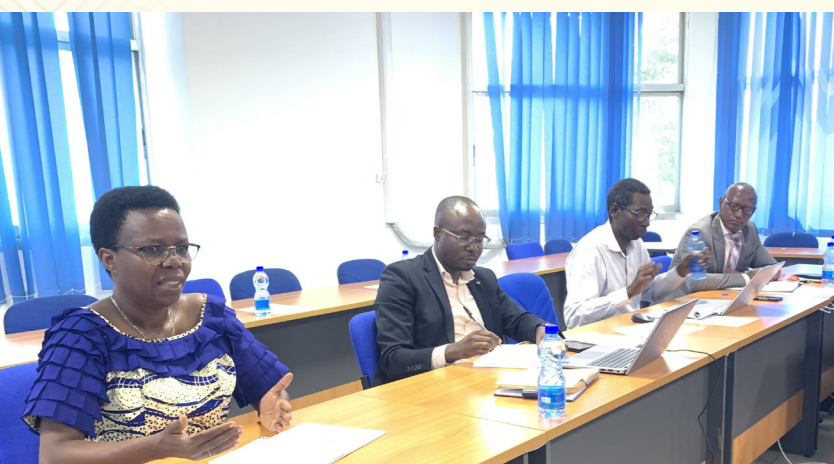
Reunião de consulta da ICGLR-RTF com os formadores nacionais do Burundi sobre SGBV no Secretariado da Conferência da ICGLR em Bujumbura, Burundi em 19 de abril de 2024.

The ICGLR-RTF commenced its operations in 2014, and is located in Kampala, Uganda.