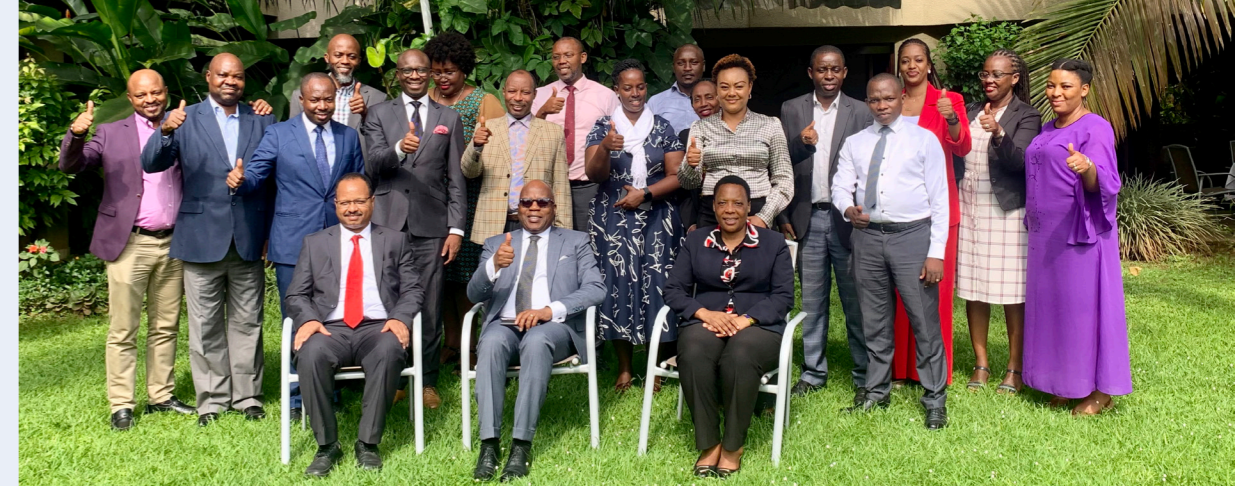
ICGLR Workshop de formação sobre o controlo e a avaliação 2024