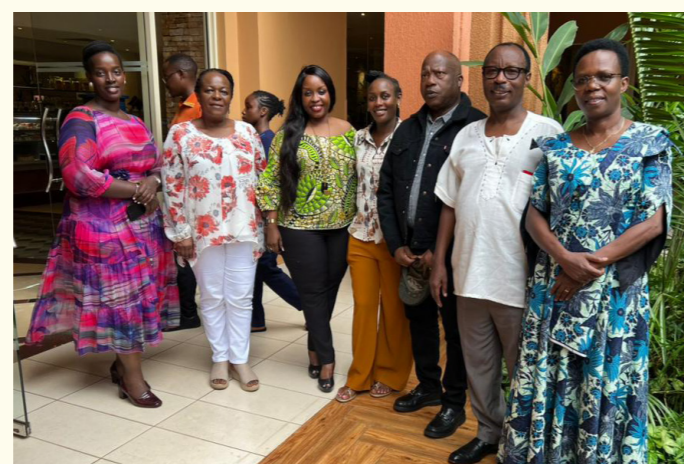
Reunião do pessoal da ICGLR-RTF com o Secretário Executivo no Serena Hotel Serena Kampala a 1 de maio de 2024